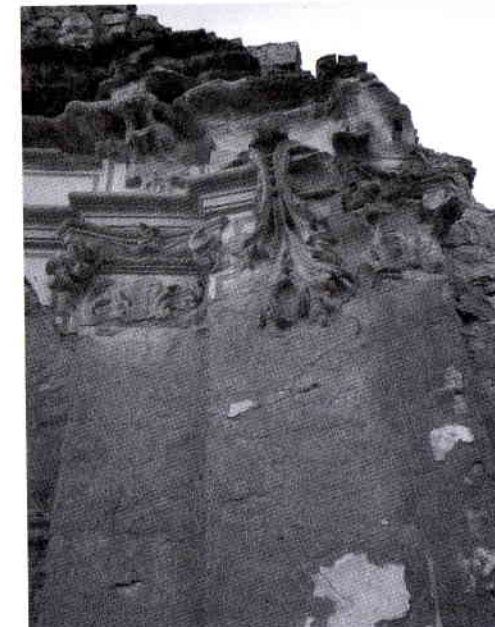
Detalle decorativo barroco en uno de los tramos de la Iglesia franciscana de San Guillén. Castielfabib.

Con todo, la primera sensación que transmite este recorrido por la iglesia de San Guillén en 1835 es de cierta desolación. En primer lugar, la capilla mayor ya había sido desprovista de su altar mayor (recordemos que había sido vendido por los propios franciscanos a la iglesia de Casas Bajas a mediados de la década de 1820 14 ) y en su lugar quedaba un humilde retablo de aljez, con tabernáculo,